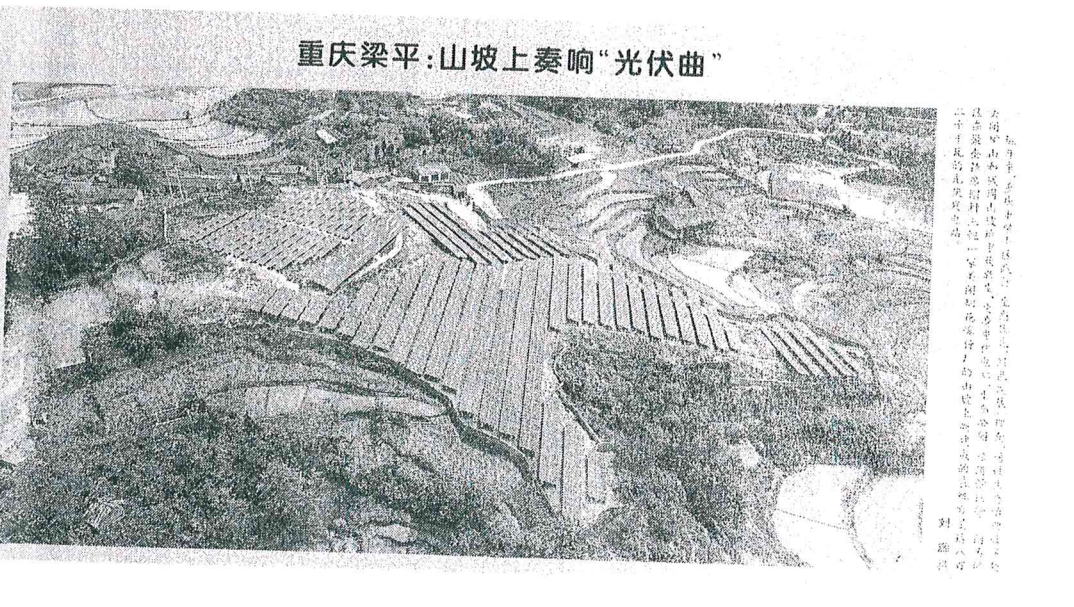
重庆梁平:山坡上奏响“光伏曲”